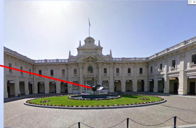
Salida de la Estación Marítima.